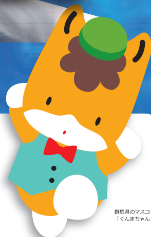
群馬県のマスコット 「くんまちゃん」