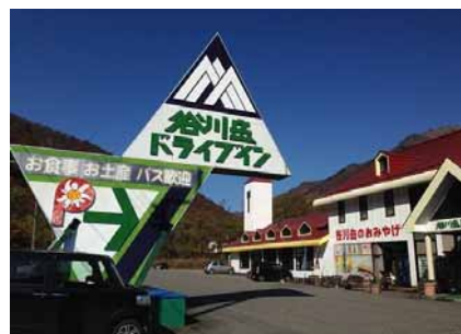
谷川岳ドライブイン