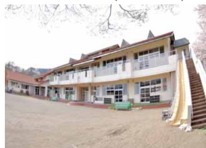
みなかみテレワークセンター

FAX: 027-243-3110 (群馬県地域政策課あて) / E-mail: chiikika@pref.gunma.lg.jp