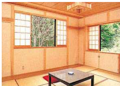
ロッジとんち宿泊部屋