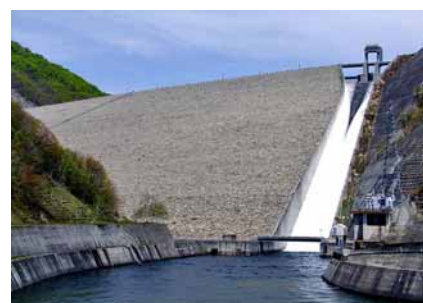
みなかみ町のダム(奈良俣ダム)