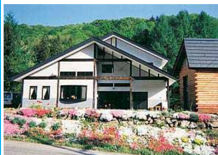
ロッジとんち外観

※作業体験を行いますので、汚れても良い服装や動きやすい服装でご参加ください。 ※当日の状況により内容が変更になる場合もございますので、予めご了承ください。